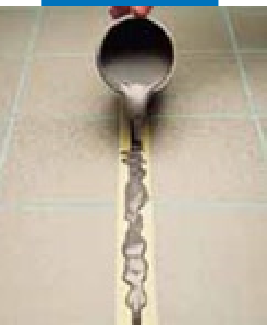
Заполнение шва Mapeflex PU21