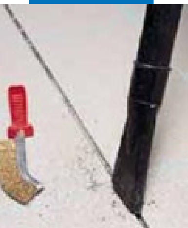
Очистка шва с помощью пылесоса