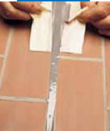
Компенсационный шов, загерметизированный Mapeflex PU21