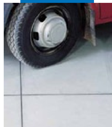
Эксплуатируемый шов, загерметизированный Mapeflex PU21